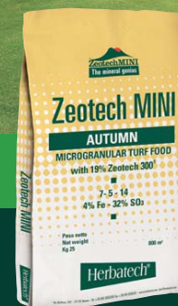
ZEOTECH MINI AUTUMN summer-winter stress control