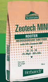
ZEOTECH MINI ROOTER new turf establishment root elongation