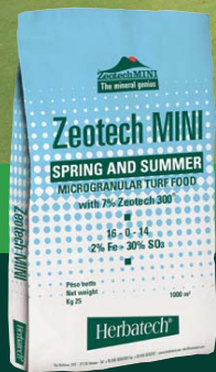
ZEOTECH MINI SPRING AND SUMMER superior slow release