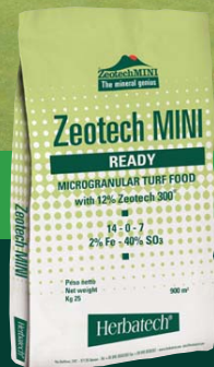
ZEOTECH MINI READY immediate and secure response